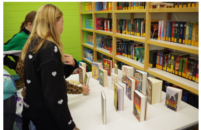
Buchpreise für die besten Drei