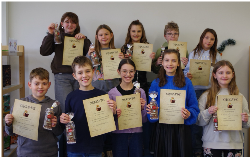
Die besten Vorleser der 5. Klassen