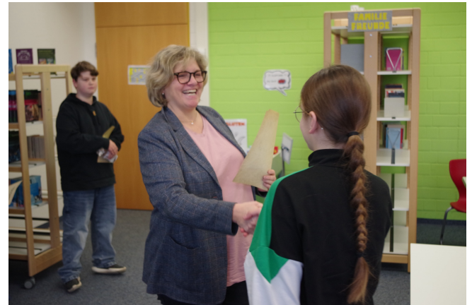
Die Rektorin gratuliert