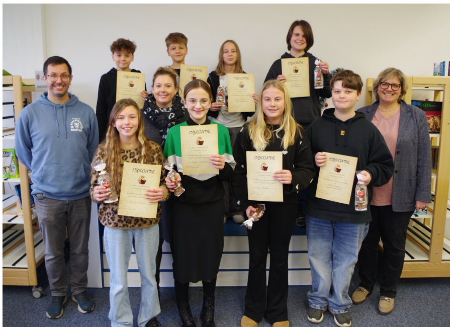
Die besten Vorleser der 6. Klassen