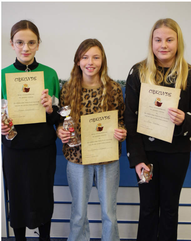
Die Siegerinnen der 6. Klassen