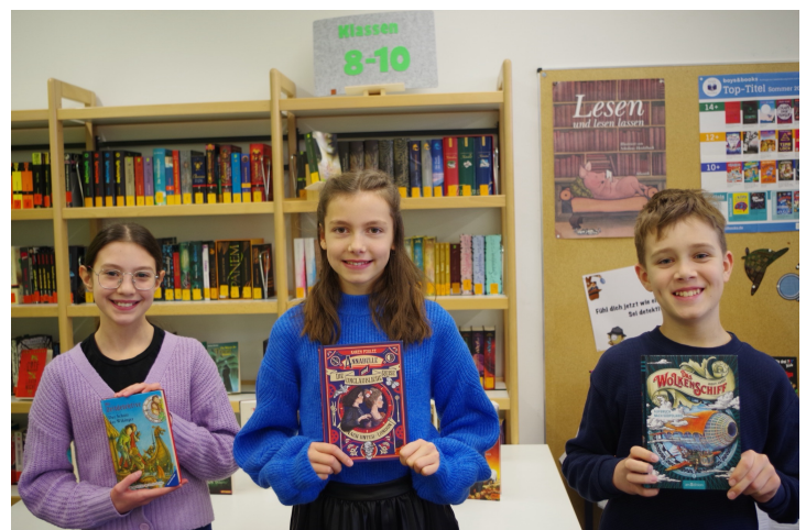
Die Sieger mit ihren Buchpreisen